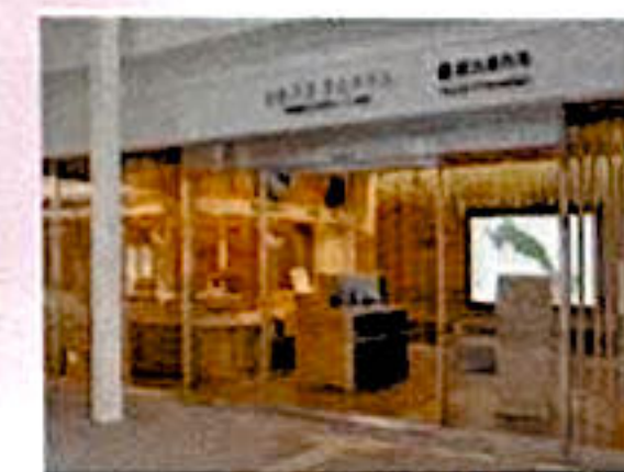
かわさききたテラス