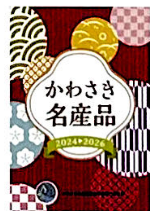
パンフレット表紙

一部の商品は川崎駅北口行政サービス施設「かわさききたテラス」でも販売しております。是非ご利用ください。